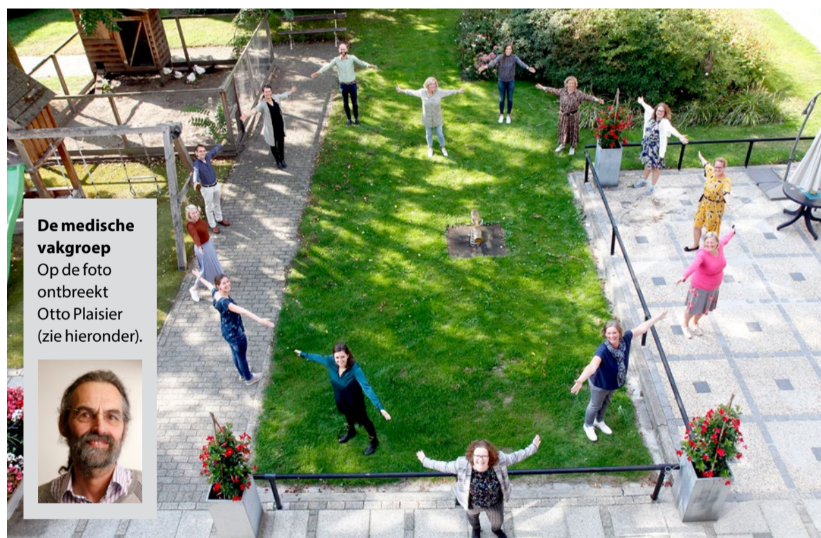
De medische vakgroep Op de foto ontbreekt Otto Plaisier (zie hieronder).